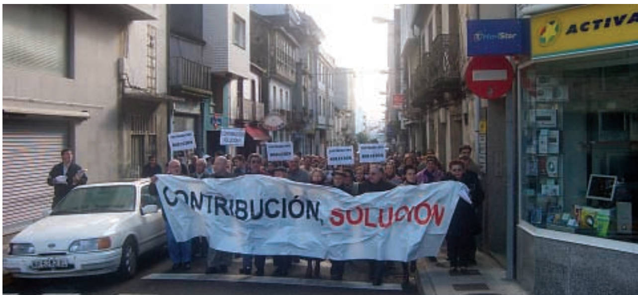
Manifestación contra o sistema de Imposto de Bens Inmóbeis (IBI) que é unha mostra de figura impositiva que non se axeita á realidade deste país

postos a aceptar. Hai pois que manter a calquera prezo as aparencias, hai que negar a realidade, a verdade.