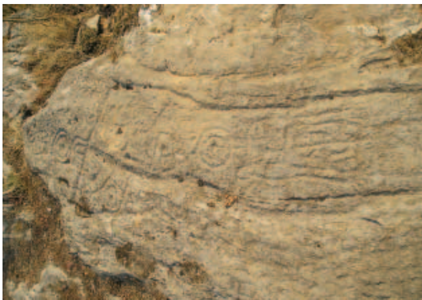
Petroglifo de Baldeiros

máis destacadas sinais de identidade da nosa terra, que mestura arte, misterio e tradicións. Tradicións cristianizando, neste caso, un lugar pagán, manténdoo como lugar significativo catro ou cinco mil anos despois: sempre as mesmas cousas con distinta data, diría León Felipe. A supervivencia de milenios, envoltos nas formas dadas polas transformacións económicas e sociais, vese, ao fin, truncada polo abandono.