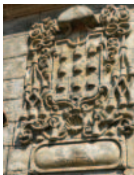
Escudo das nove mitras

Principiamos o camiño no lugar de Portizó, na parroquia de Anllo. Cruzaremos os ríos polo paso da Barca de Santo Estevo, primeiro o Cabe cara a Pantón e logo o Sil cara a Nogueira de Ramuín, e seguiremos camiño cara ao mosteiro. Nos Penedos do Castro deterémonos na contemplación do andado: Camiño Real tamén na súa materialidade física, realidade espiritual no relixioso e no fantástico, ao lle superpor ao vieiro o descomunal salto do cabalo de Santiago, desde a pedra do Baldeiros, a carón do viaxeiro, até as Cirdeiriñas, na orela ourensá, por riba mesmo do mosteiro bieito. Eso si, conformarémonos, humildes mortais, cos humanos medios, poñendo a pé, medida ao espazo e á paisaxe.