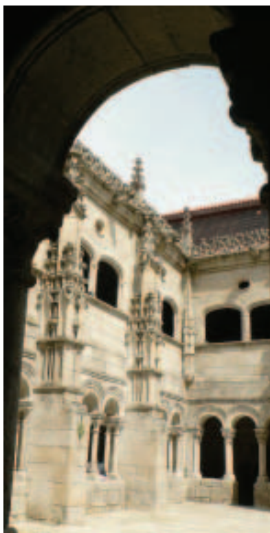
Claustro dos Bispos

español. Xa cantaron as coplas de entroido aquilo de: Estamos os primeiriños, / podemos estar ben ledos, / quedámonos sen veciños / pero somos os máis vellos. / As funerarias cotizan / has me de dar a razón! / Os curas xa non bautizan / pero dan a extrema unción. Vendo estas aldeas, verdadeira lección etnográfica a cada paso, cos hórreos, fornos, corredores, pombais, artísticos poleiros, olas de Gundivós coroando os teitos, encachotados debuxando os muros, lavadoiros, fontes, e tantas outras respostas ao medio, ás veces estragadas pola modernidade do cemento, o ladrillo e o inverosímil, moi próximo á gargallada; vendo estes recunchos, hoxe esmorecidos, reflectindo a vida e o desexo, inmersos nunha natureza sempre exuberante, dámonos conta da importancia de manter a poboación para seguir conservando respectuosamente as aldeas e delineando na paisaxe os eidos humanizados.