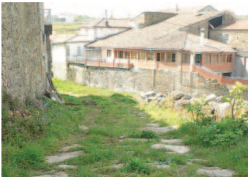
Entrada a Portizó polo Camiño Real