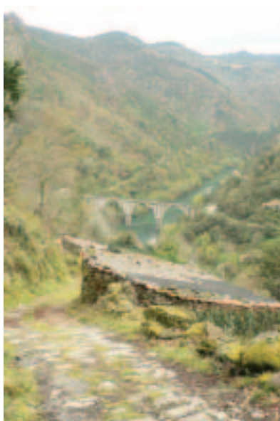
Camiño Real na Barca

Nestes camiños o mundo ten aberturas, espazos que se renovan a cada segundo, transformándonos por dentro, porque o marabilloso lle sae de súpeto ao viaxeiro. O camiño ten sempre algo de epifanía, con cheiros que activan resortes, chaves abrindo cada reviravolta. Non é difícil imaxinar, aquí, aos homes buscándose a si mesmos e créndose máis cerca do numinoso. Froito de todo eso son as capelas de posíbel orixe eremítica que marcan estes lugares: as ruínas de San Miguel de Canal, con antiquísimas inscricións, e as referencias ás capelas da Nosa Señora, Santa Cruz ou Santa Baia, de por si topónimo significativo, ou a capela de San Xoán de Cachón, á que se accede desde Santo Estevo, co lintel recordando o abade Frankila que puido rexer, polo s. X, antes da restauración do mosteiro, por aquelas "abandonado de antigo", unha comunidade de eremitas. Lugares de recollemento e oración, enchendo os pregues destes montes onde os regos perden a compostura para caer a berros polos precipicios.