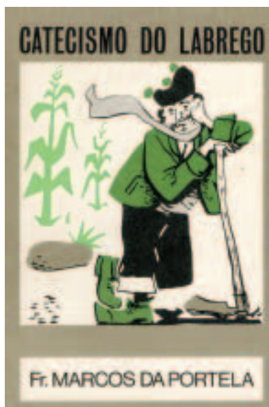
Obras clásicas galegas recuperadas polo labor editorial de Xosé M a Álvarez Blázquez

Desta ansia se vai alimentar Xosé María Álvarez Blázquez, que naceu, como dixemos, en 1915, e a esta vocación de servizo á lingua e á cultura galega vai servir co seu traballo e a súa dedicación literaria, xornalística e editora durante toda a súa vida. É, pois, fillo político e espiritual dos artífices do Segundo Renacemento da cultura galega, que, programaticamente, vai certificar a celebración, en Lugo (Novembro de 1918) da I Asemblea Nacionalista, que proclamará a “soberanía estética da Nación Galega”.