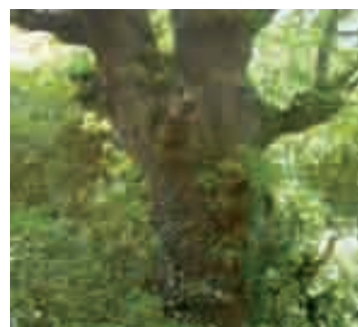
Mosteiro de Samos, fachada principal, abaixo, carballo de Piteiro

Na necrópole de Santa Mariña, ao longo da serra do mesmo nome, viaxamos a finais do Neolítico e comezos da Idade de Bronce (do IVº ao IIº milenio a. de C.). Nela converxen tres concellos: O Incio, na parroquia de Santa Cristina do Viso; Samos, na parroquia de Santiago de Formigueiros e Sarria; en San Martiño de Loureiro.