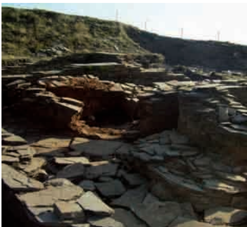
Castro de Formigueiros

É un espazo de grande valor arqueolóxico, tanto pola cantidade de medorras -máis de medio cento- como polas características das mesmas. Hai, así mesmo, xacementos en que se poden apreciar gravados rupestres.