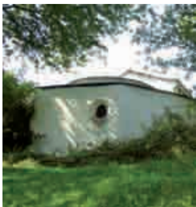
Igrexa de San Salvador do Mao