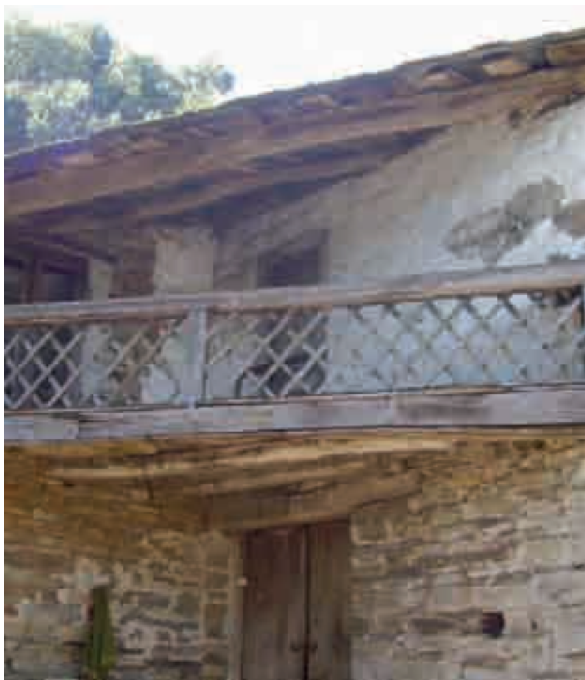
Casa en San Salvador do Mao

A Asociación Cultural "Ergueitos" de Sarria, promotora de múltiples iniciativas para manter viva a memoria do poeta, organizou unha ruta desde a Fonte da Cova até a fervenza, na que diversos artistas plásticos están a instalar as súas esculturas.