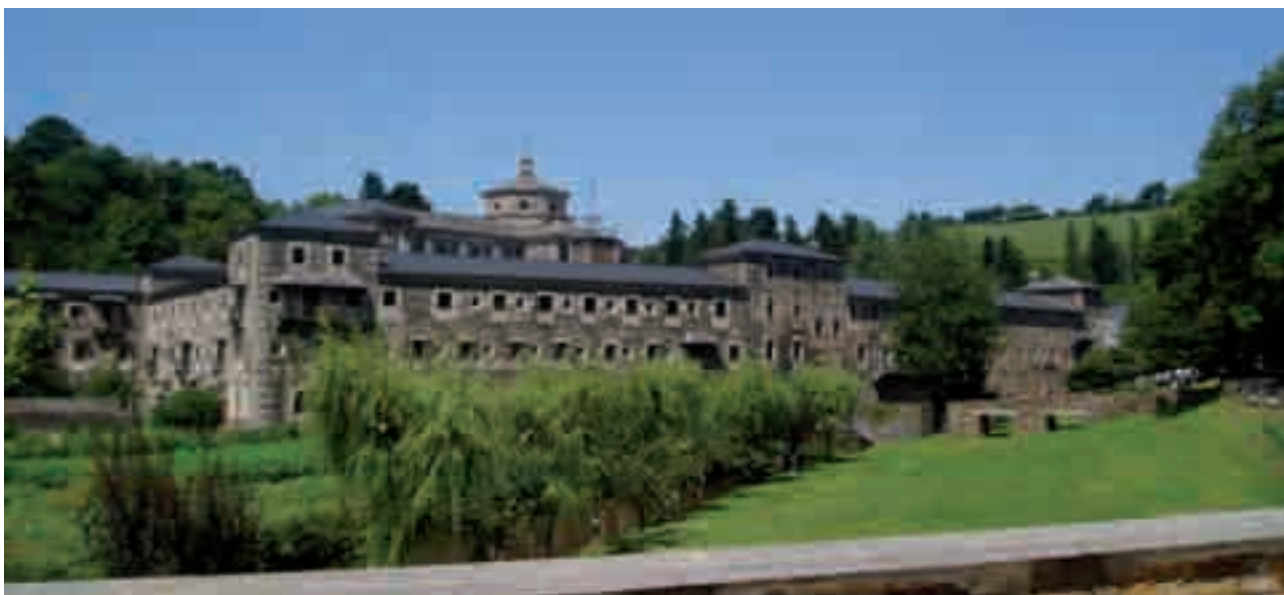
Mosteiro de Samos, fachada do río

tangular, con torre cuadrangular situada nun dos laterais, e capela con cúpula noutro ángulo, ten ademais un souto e unha carballeira frondosos. Pertenceu á familia Durán Loriga até que foi adquirido e restaurado para dedicar a turismo rural. Parece ser que cesou nesta actividade porque a mercou un construtor galego afincado en Inglaterra. Aínda así, non é difícil visitalo.