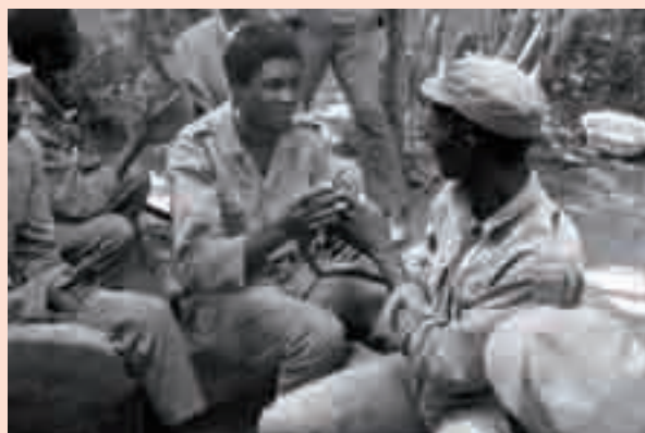
Guerrilleiros do PAIGC na Guine-Conacri, 1970