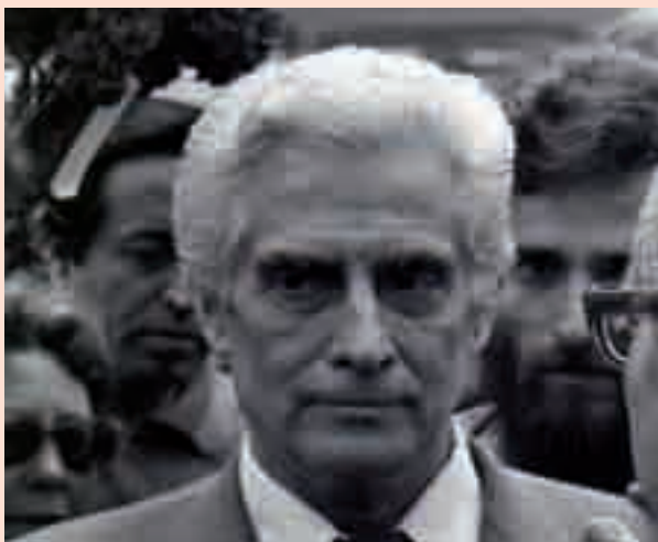
Álvaro Cunhal, dirigente histórico do PCP, sai em 1974 da clandestinidade

A existência de um amplo movimento que abrange centenas de oficiais do quadro permanente dos três ramos das forças armadas, assim como a eclosão da sublevação de 16 de Março - afirma-se num dos dois manifestos de Março da Comissão Executiva do PCP - «exprimem a crescente oposição das forças armadas às guerras coloniais e à política do governo de M. Caetano.»