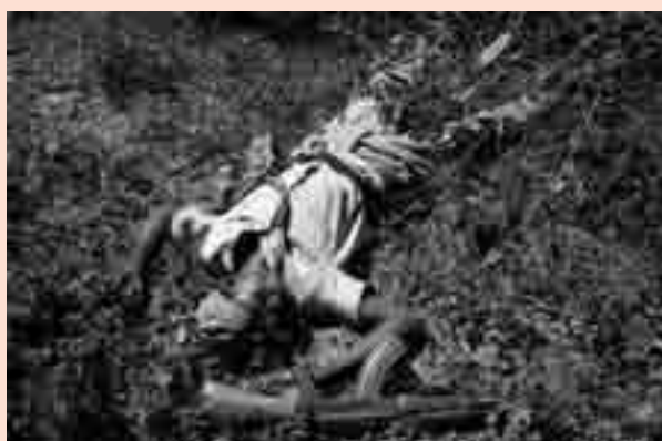
Guerrilleiro morto do PAIGC, 1970