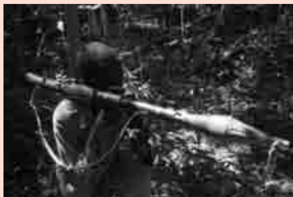
Guerrilleiro do PAIGC no 1969