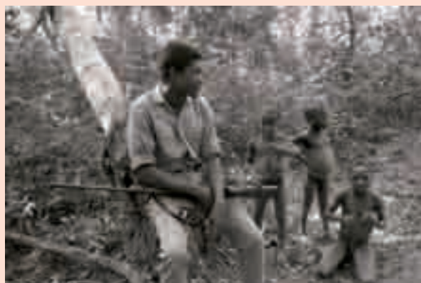
Os guerrilleiros do PAIGC entre a paleolítico e o século XX, 1970