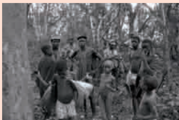
A guerrilla contou co apoio da poboación, 1970