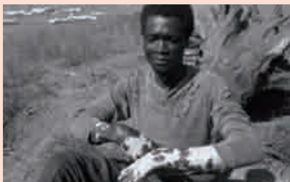
Vítima do NAPAL usado polas tropas coloniais portuguesas, 1970