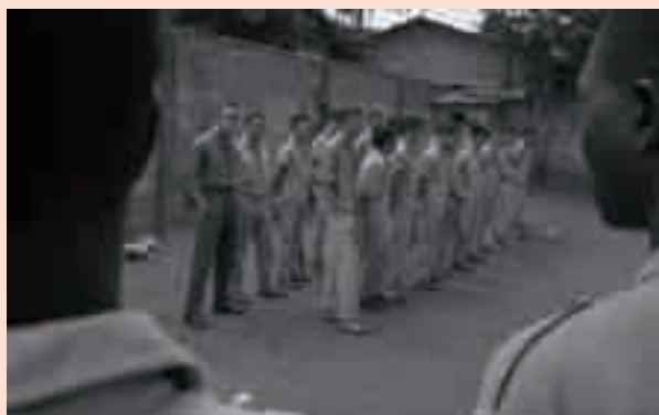
Prisioneiros militares portugueses nunha prisión da guerrilla do PAIGC na Guine-Bissau 1970