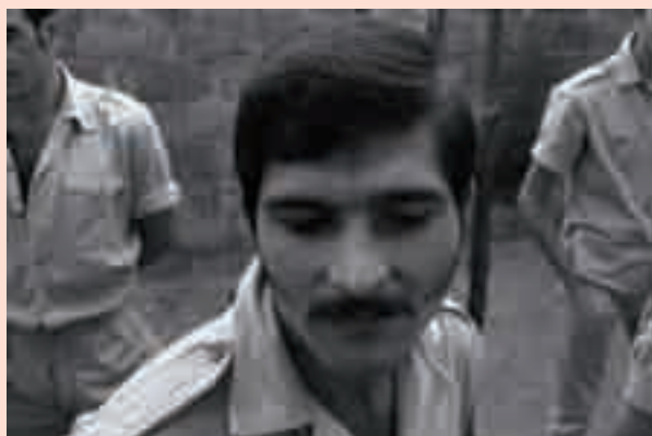
Prisioneiros militares portugueses nunha prisión da guerrilla do PAIGC na Guine—Bissau en 1969