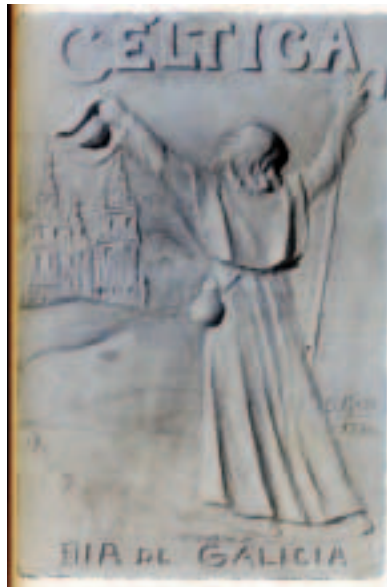
Portada dunha revista galega da emigración con motivo do día da patria. Baixo releve de Domingo Maza

Otero cualifica Prisciliano de ser a figura máis senlleira da historia ga-