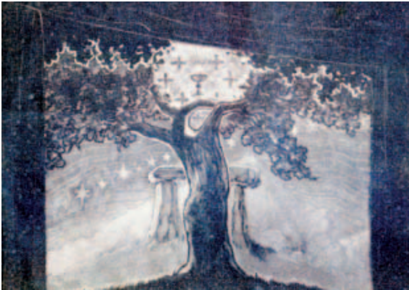
Decorado dunha obra de teatro feito por Camilo Díaz Baliño

trinas, que esnaquizaban os habitantes de Hispania, con meirande estraño que os bárbaros esnaquizaban os corpos”. Especialmente contra Prisciliano, escribiu o Commonitorium de errore Priscillianistarum et Origenistarum 8 .