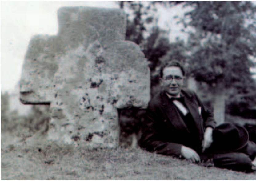
Castelao na Bretaña. Fixo unha análise profunda sobre o xeito de fundirse a relixiosidade popular coa oficial e as relacións precristiás de dita relixiosidade entre diferentes pobos como é o caso do galego e o bretón

probablemente, nada que ver con el priscilianismo 42 .