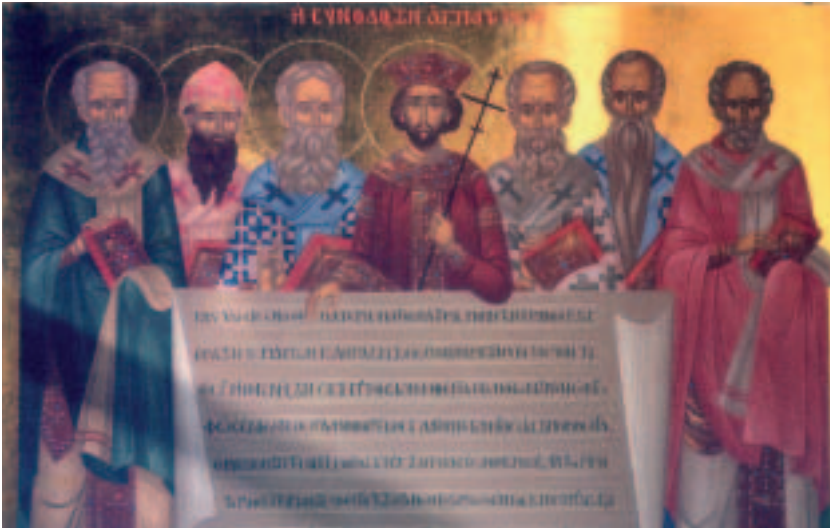
Representación do Congreso de Nicea