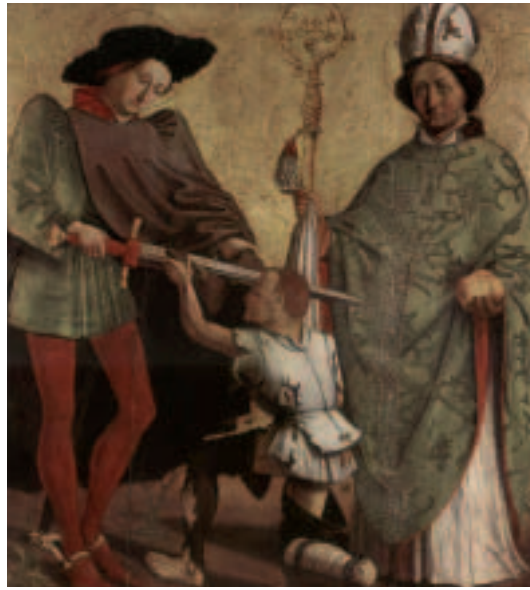
Representacións de Martinho de Dume e Martiño de Tours

Na Gallaecia, a estrutura eclesial era menos definida. En Roma, no s. IV, segundo Eusebio de Cesarea, “o bispo presidía unha comunidade na que había 46 presbíteros, sete diáconos, sete subdiáconos, 42 acólitos, 52 exorcistas, lectores e vixiantes, máis 1500 viúvas e outros necesitados a alimentar”. Así o comunicaba o bispo Cornelio ao obispo Fabio de Alexandría (Eusebio mde Cesarea, Historia da Igrexa, VI, 43, 11). Cálculos hai, segundo os que Roma tiña uns 700.000 habitantes, dos que eran cristiáns uns 7.000.