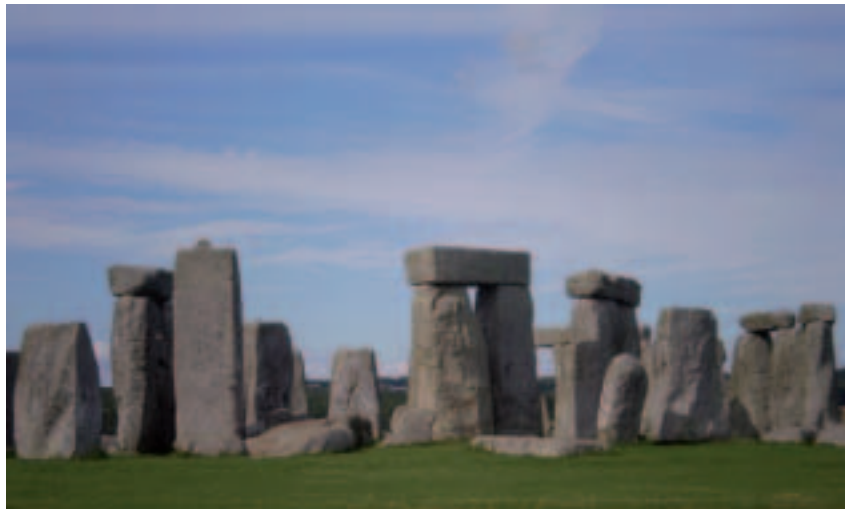
Stonehenge é un monumento neolítico e da idade de bronce situado preto de Amesbury en Wiltshire, Inglaterra. Cando se estendeu o cristianismo por Europa tivo que axeitarse a un conxunto de crenzas previas moi arraigadas desde tempo inmemorial

RELACIÓNS CO PAGANISMO. Non temos datos de enfrontamento do cristianismo co paganismo na Gallaecia. Non houbo mártires aquí en ningunha das persecucións, indicio da