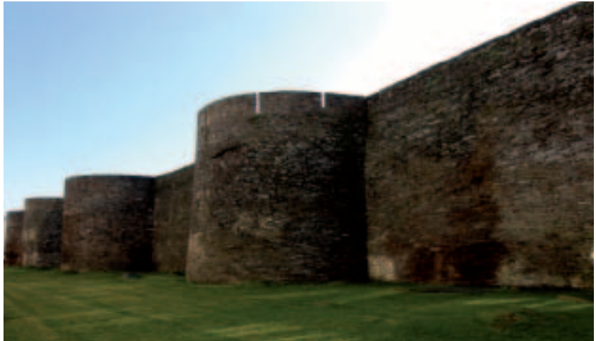
A muralla de Lugo data da época romana, comezando coa súa construción probablemente contra o ano 260, ao medrar a importancia de Lucus Augusti como centro de comunicacións e comercial do norte peninsular. A devandita construción delongouse ata a época de Constantino, rematando sobre o ano 325. Esta muralla da conta do esplendor da Galiza romana do século III e IV

O CRISTIANISMO NA GALLAECIA. Había cristiáns na Gallaecia no s. III como acredita a correspondencia con San Cibrán, a mediados do III-do 252 ao 255. Este escribe aos fieis das igrexas de Mérida e León e dá a entender