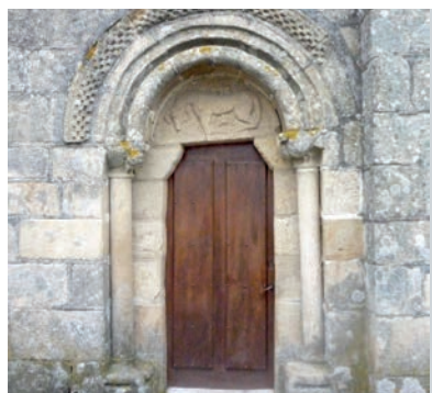
Igrexa de San Pedro de Canabal (Sober)