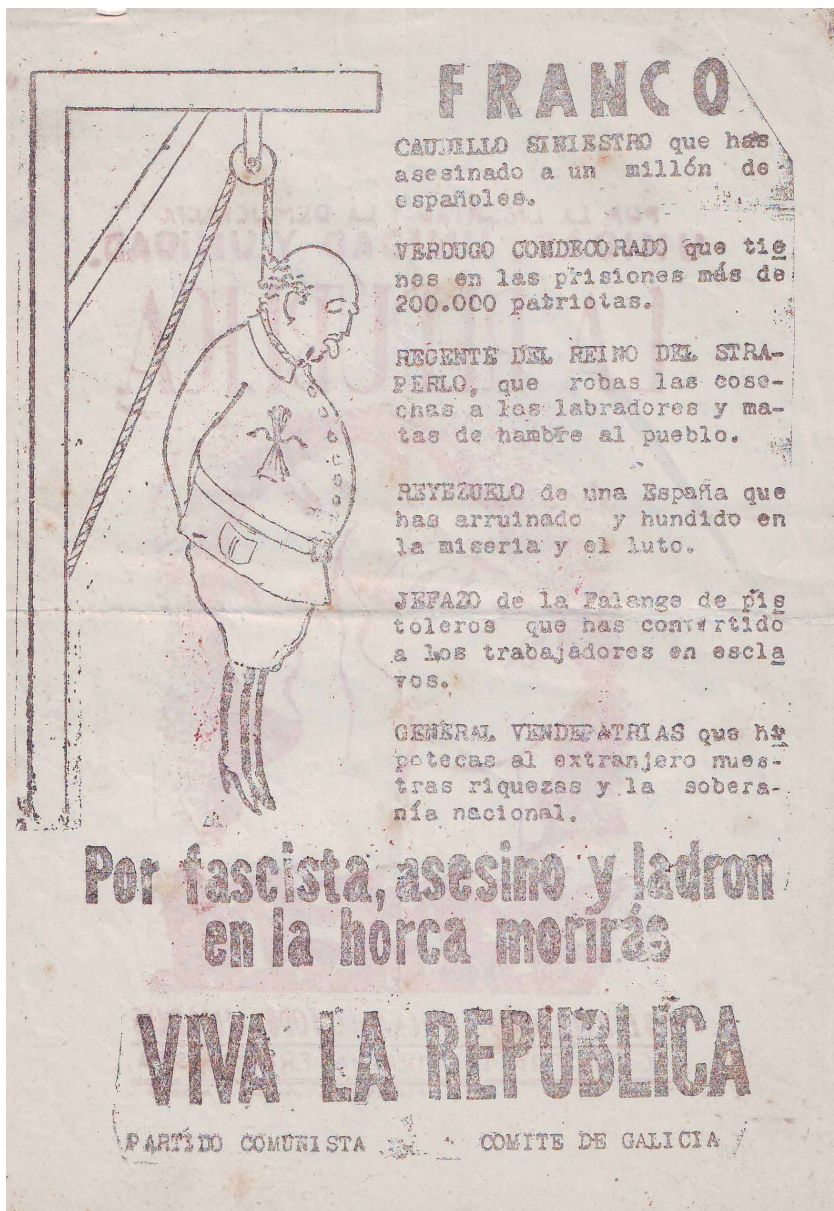
Folla voandeira do Comité de Galiza do Partido Comunista