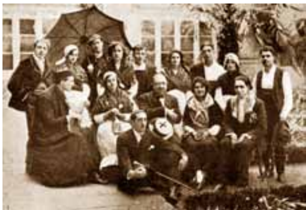
Grupo teatral da Universidade que representou Trebón. Compostela, 1922