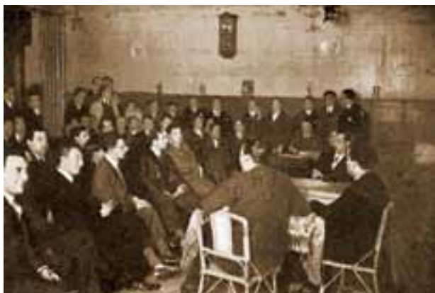
Asemblea constituinte do Partido Galeguista. Pontevedra, 1931

marxinal (5 %), a dos sectores populares urbanas moi escasa (10 %) e a do campesiñado nula.