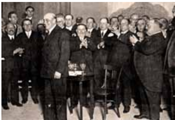
Ramón Cabanillas, en primeiro plano, nunha homenaxe en Vigo. 1927

Ese poeta debe de estar nacido ya, es nacido seguramente... Pero el tiempo aún no es para su evangelio sin duda. Hay, pues, que prepararle advenimiento, hay que ponerse en ansias vivas, en expectación de gentes. [...]