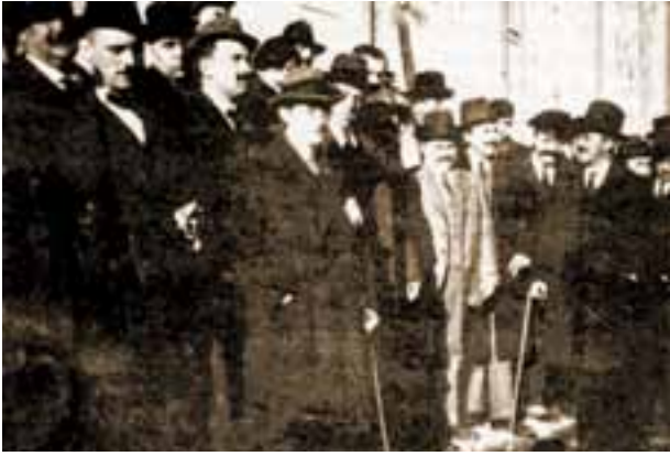
Asistentes á Asemblea Nacionalista de Lugo. 1918

expresión utilizada polas Irmandades da Fala) hai unha moderación táctica, que non estratéxica, pois a realidade do Estado Integral forza a aceptación transitoria dunha autonomía limitada.