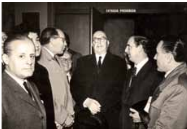
Daniel Castelao e Ramón Otero Pedraio en Bos Aires. 1947

de personalidade propia 3 , até aquí ignorada por el mesmo: «Comezo a percatarme do qu'hai de diferente en min e nos galegos (...). Por primeira vegada referíase á personalidade da Galiza» (OTERO PEDRAYO 1930: 136-137).