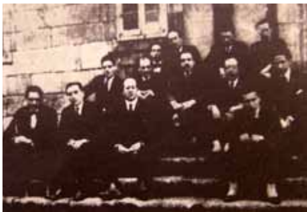
Asemblea Nacionalista de Monforte. 1922