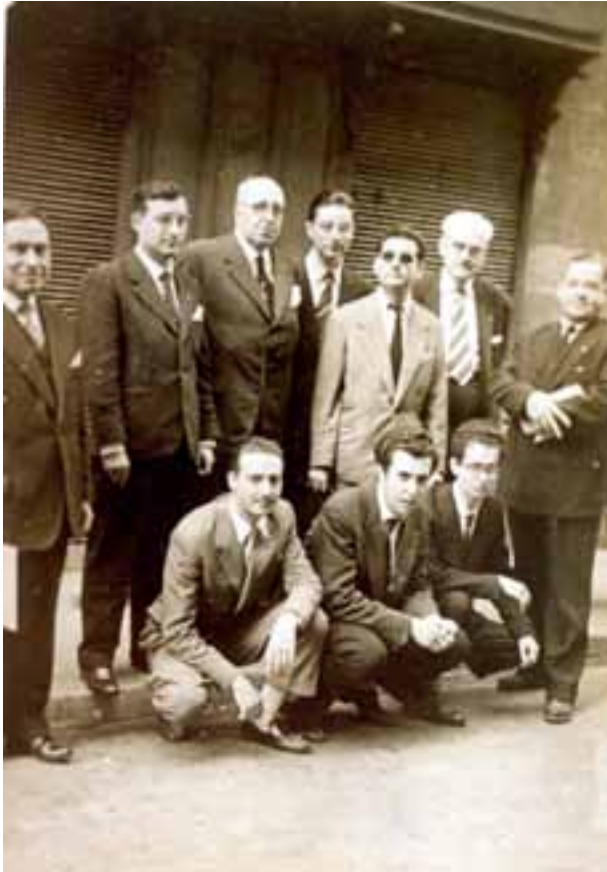
Otero Pedraio con membros do Brais Pinto. Madrid, 1958