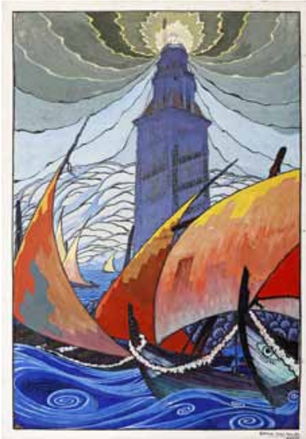
Torre de Hércules de Díaz Baliño

xustificaba «pola acefalia que supón o desexo de definir co pasado a hora de hoxe».