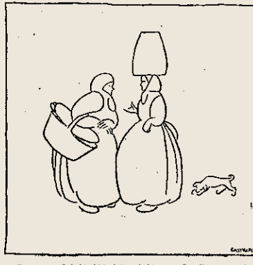
Do que morreu D. Andrés, ficha de "macerología", que no día milia ano, que a lea no predo.