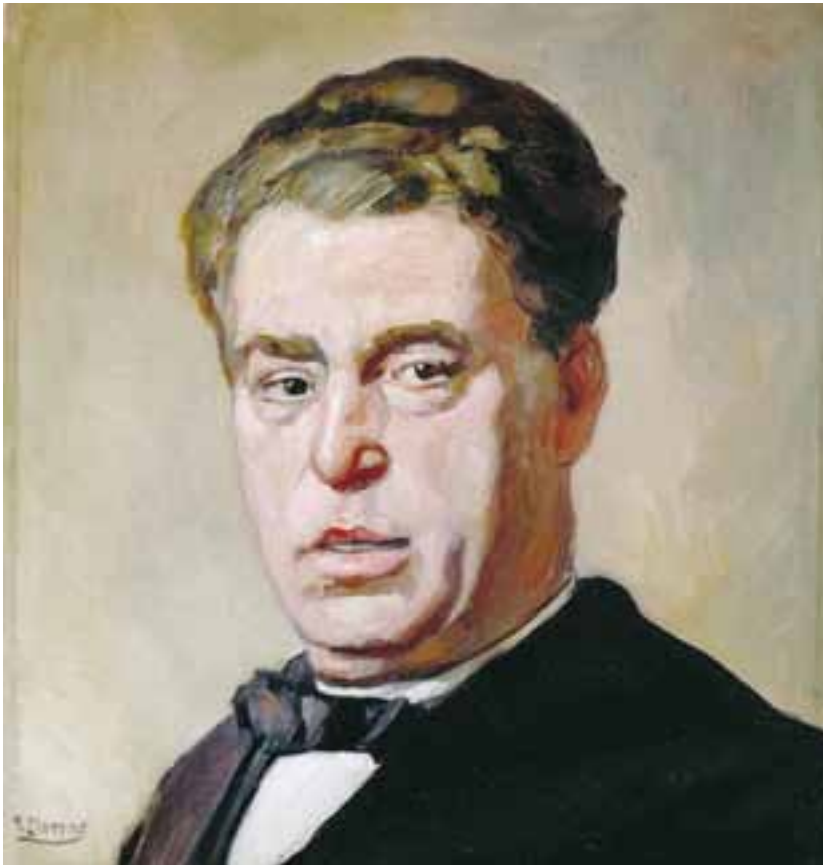
Basilio Álvarez. Retrato de Francisco Llorens

lacraca caciquil, pois había que impor unha política, definida fóra, ao servizo de intereses alleos a través de institucións estrañas ao país, para a vontade popular colectiva non tomar conciencia da propia realidade e se expresar libremente. Porén, a focalización privilexiada e punxente na figura do cacique, como elemento a bater, sen maiores consideracións, impedía facer unha valoración do papel do Estado español como opresor. É máis, a política anticaciquil agrarista sempre rendeu culto á idea de España e a españolidade, constituíndo, malia a súa retórica anticaciquil, unha das fontes de interiorización do sentimento de españolidade entre as clases populares do campo 2 . As Irmandades da Fala, non só non espallaban esta versión dominante, senón que se esforzaron por crear e espallar, culturalmente, unha versión histórica, uns símbolos