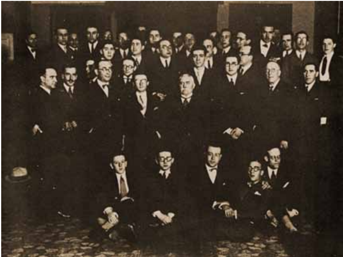
Asemblea xeral do Seminario de Estudos Galegos. Compostela, 1926