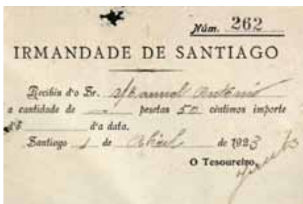
Recibo de socio da Irmandade de Santiago. 1923