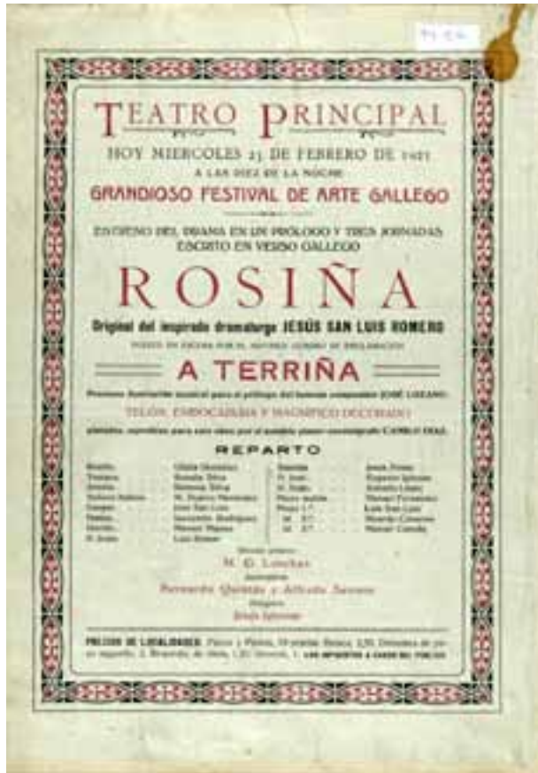
Cartaz anunciador de Rosiña. Compostela, 1921