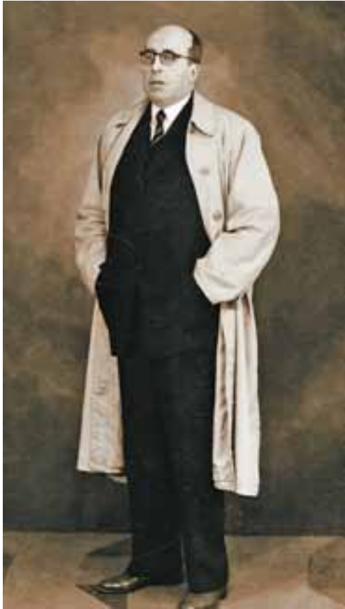
Ramón Otero Pedrayo. Ourense, anos 40

«En tres noites de Compostela fixaba Martiño os seus tres estadios do sentimento do coñecemento amoroso de Galiza» (Otero Pedrayo, 1935: 74)