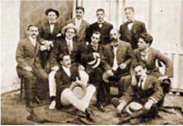
Antón Vilar Ponte en Cuba