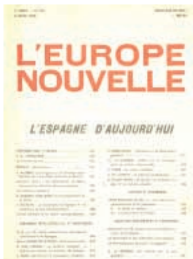
Portada da revista francesa de onde está extraído o presente artigo.