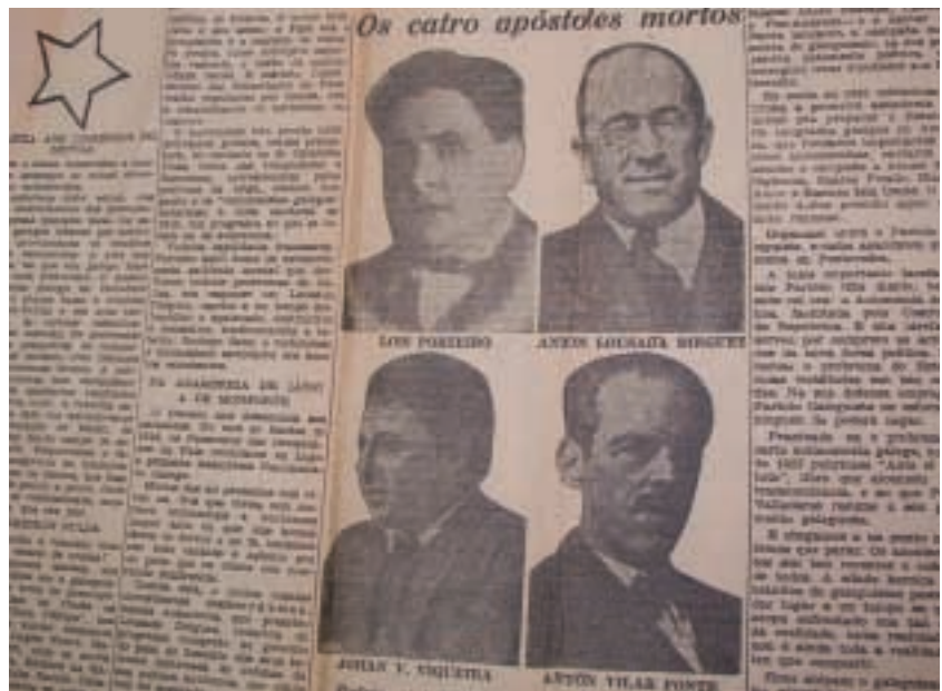
O 28 de xuño do 36, cando ao fin Galiza pode dotarse de institucións propias, no xornal El Pueblo Gallego , houbo quen soubo lembrar a quen antes loitara para que chegara ese día, e que non ía poder velo xa. Logo desda data non habería tardar outra na que quedarían frustradas de novo tantas ilusións.