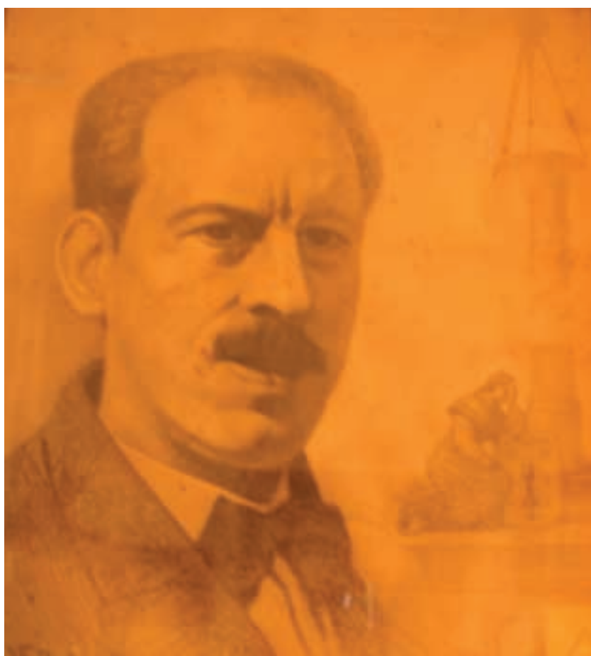
Retrato de Antón Vilar Ponte que reflicte ao fondo unha muller chorando representando ao país que sofre e fronte ao que as "Irmandades" xa non serán insensíbeis

grinos, ofereceu ao mundo unha cultura cunha proxección inmortal.